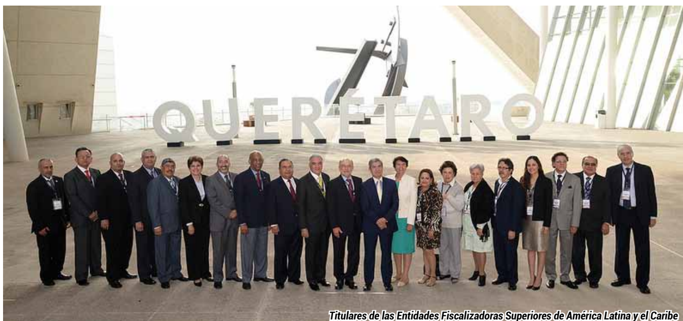
Titulares de las Entidades Fiscalizadoras Superiores de América Latina y el Caribe