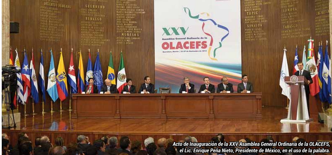
Acto de Inauguración de la XXV Asamblea General Ordinaria de la OLACEFS, el Lic. Enrique Peña Nieto, Presidente de México, en el uso de la palabra.