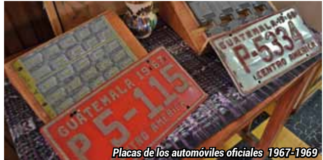
Placas de los automóviles oficiales 1967-1969

Con la llegada de la Segunda Guerra Mundial, la comunidad alemana asentada en Guatemala sufrió graves consecuencias, entre ellas la expropiación del edificio del Banco Nottebohn Hnos., por parte del entonces Presidente, el General Jorge Ubico, pasando a propiedad del Estado en 1942 y cuatro años después el Presidente Juan José Arévalo inauguró en este inmueble la primera sede del Banco de Guatemala.