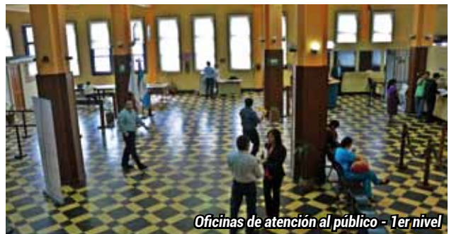
Oficinas de atención al público - 1er nivel