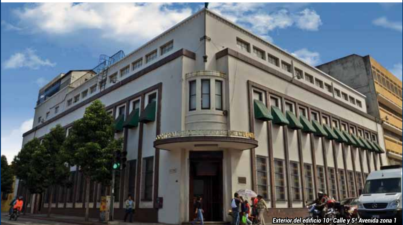
Exterior del edificio 10ª Calle y 5ª Avenida zona 1

Y el cuarto nivel está integrado por la oficina de Cuentas Corrientes, Inventarios y la cafetería para el personal.