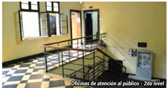
Oficinas de atención al público - 2do nivel