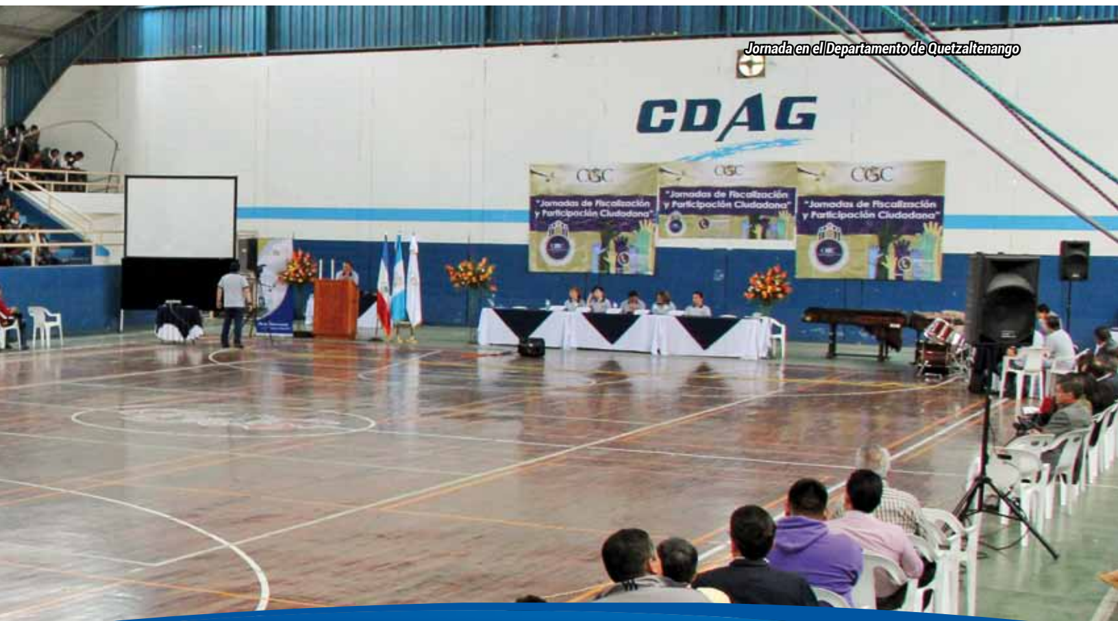
Jornada en el Departamento de Quetzaltenango

Las Jornadas se continuarán realizando el próximo año 2016 en el resto de departamentos.