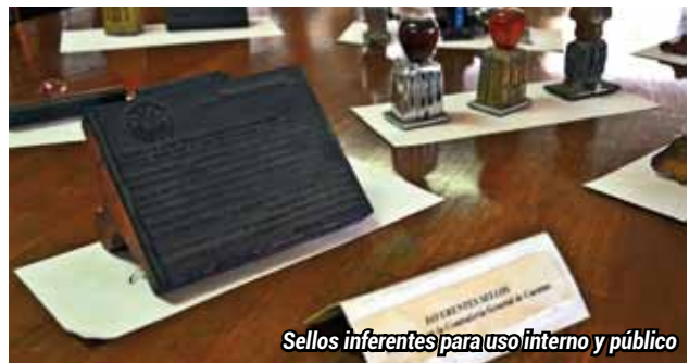
Sellos inferentes para uso interno y público