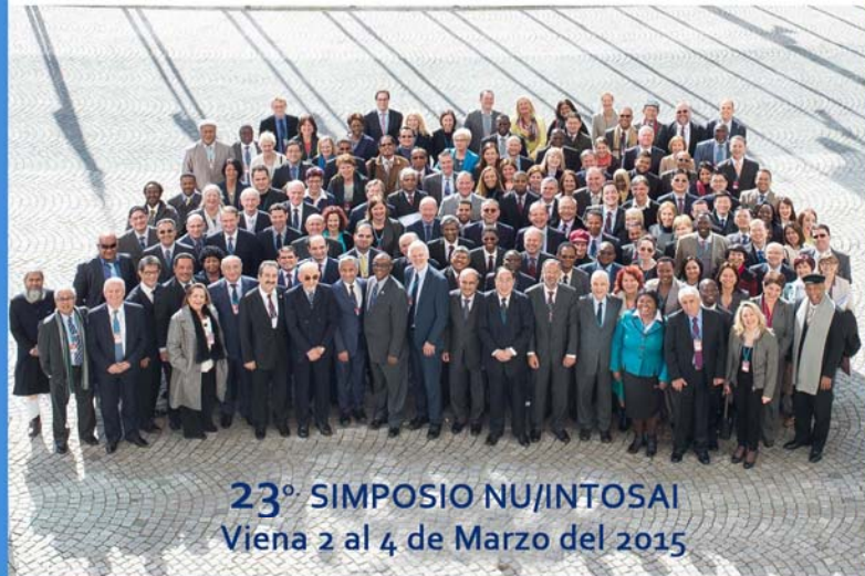
23° SIMPOSIO NU/INTOSAI Viena 2 al 4 de Marzo del 2015