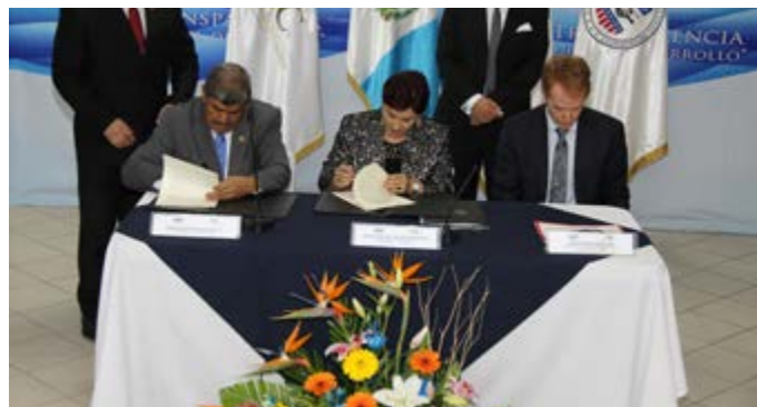
CGC y Ministerio Público durante un Convenio de Cooperación Interinstitucional.

Como parte del cumplimiento del Compromiso No. 14 del Tercer Plan de Acción Nacional de Gobierno Abierto, se suscribieron cartas de entendimiento con 211 municipalidades del país y la organización Acción Ciudadana, para acordar la implementación de mecanismos y procedimientos estandarizados para la rendición de cuentas de los gobiernos locales.