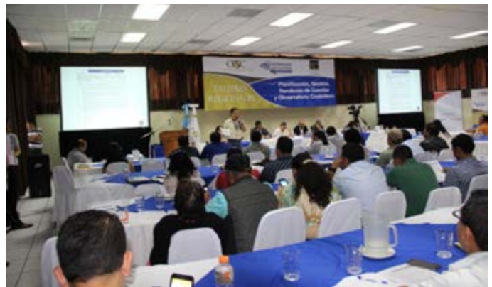
2do. Taller Regional de Alcaldes (Región Nororiente).