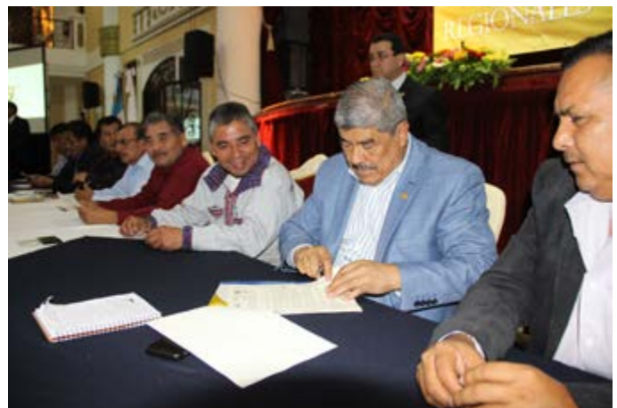
3er. Taller Regional de Alcaldes (Región Occidente).