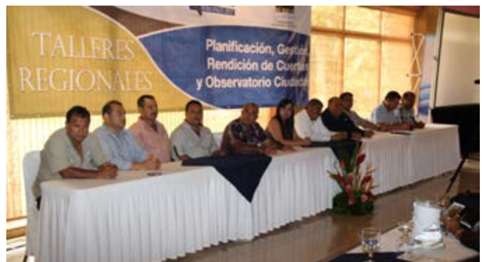
4to. Taller Regional de Alcaldes (Región Suroccidente).