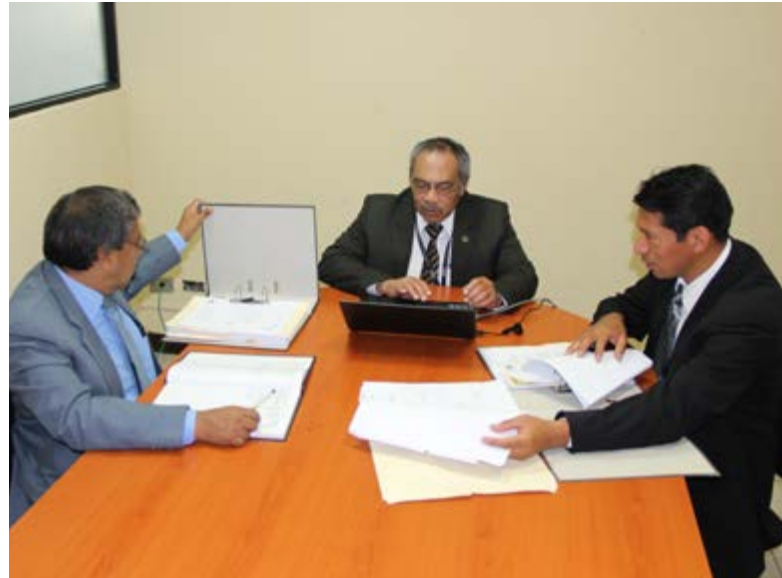
Audidores durante una revisión de papeles.

Con esta nueva forma de trabajo, la Contraloría General de Cuentas espera hacer un mayor aporte en beneficio del desarrollo del país, respondiendo de mejor manera a las expectativas de la sociedad guatemalteca.