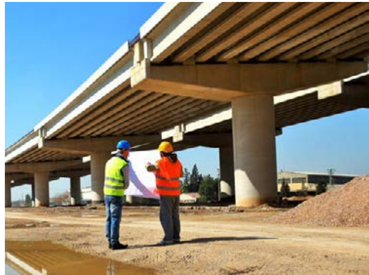
El Enfoque Sectorial, permite verificar en el campo de acción la calidad de las obras.