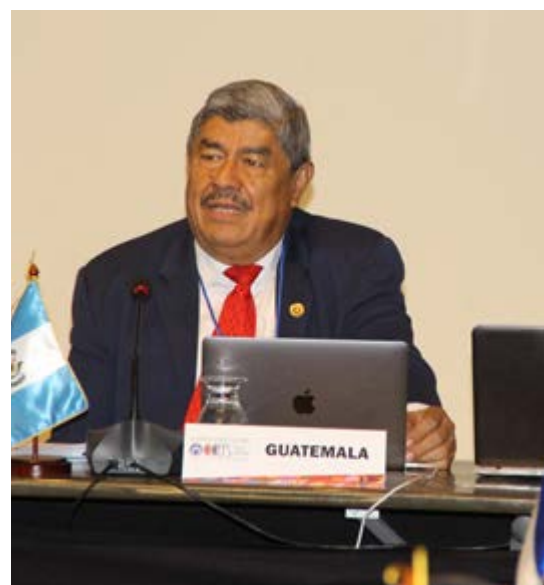
Lic. Carlos Enrique Mencos Morales, Contralor General de Cuentas de Guatemala, Presidente de la OCCEFS.

En el ámbito legal, se aprobaron los nuevos Estatutos de la Organización, quedando derogados los anteriores aprobados en 1999 y sus posteriores reformas, con lo cual se guarda consistencia con las normativas de las organizaciones regional y mundial de EFS, OLACEFS e INTOSAI, y se da respuesta al contexto y entorno actual, respondiendo a la visión estratégica de la OCCEFS plasmada en el Plan Estratégico Institucional (PEI) 2017-2022.