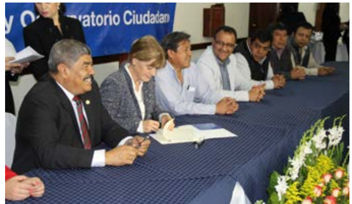
1er. Taller Regional de Alcaldes (Región Central).

Con el cumplimiento oportuno de este compromiso se logró la implementación de un mecanismo innovador para la rendición de cuentas de los gobiernos, requiriendo para ello una serie de actividades de coordinación, con el propósito de construir un cambio significativo y transformador en la gestión pública local, que contribuye a la transparencia, la rendición de cuentas, la participación ciudadana y el acceso a la información pública, por medio de la innovación tecnológica.